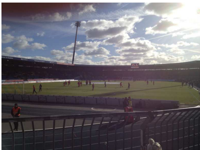
Die Mannschaft macht sich warm im weiten Rund...