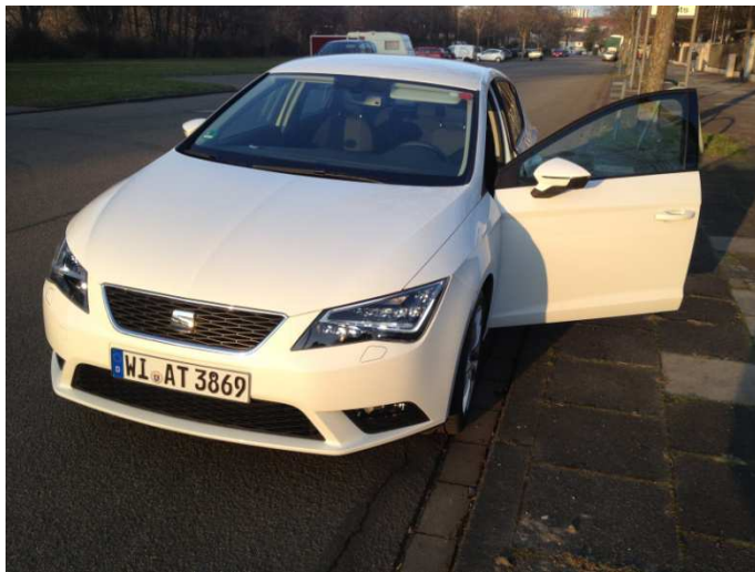
Auf dem Weg nach Niedersachsen...