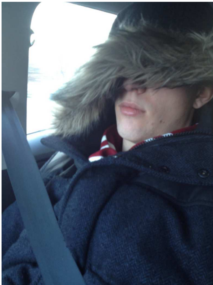
So ne Fahrt macht müde