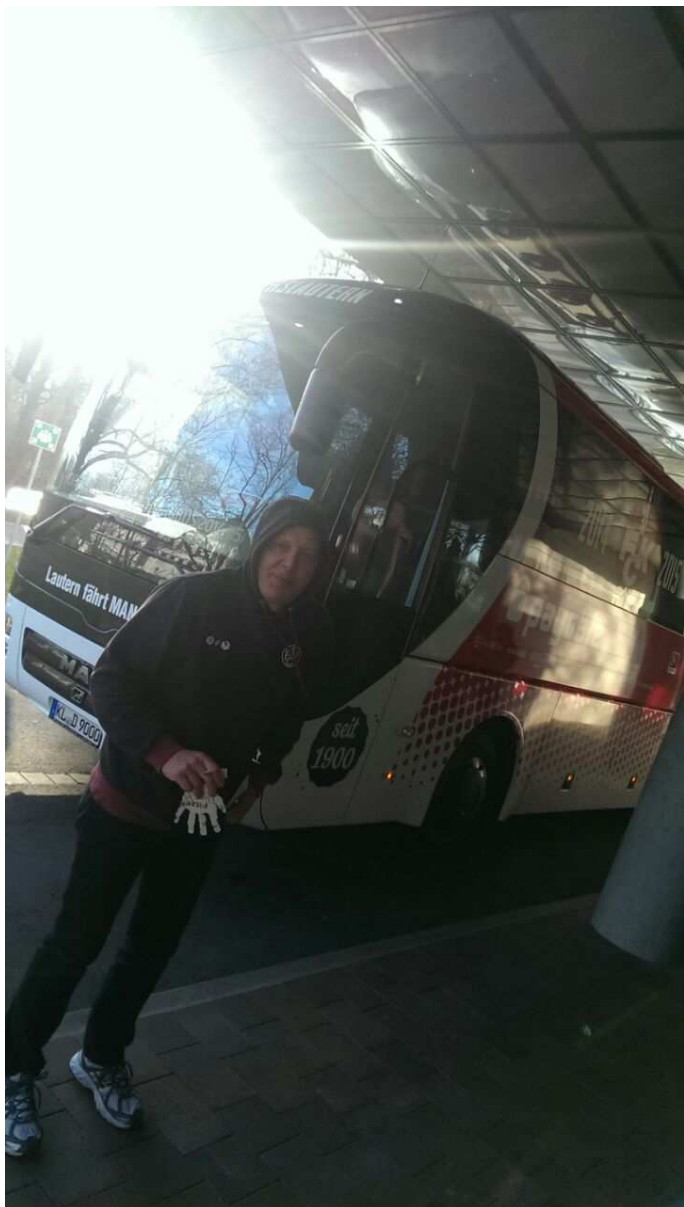
Kalt war's vor der Abfahrt ins Stadion...