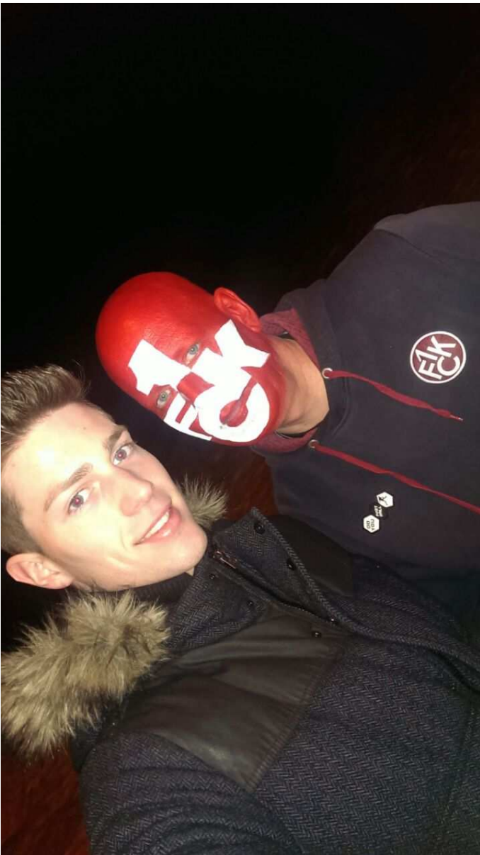
So fahren Sieger heim