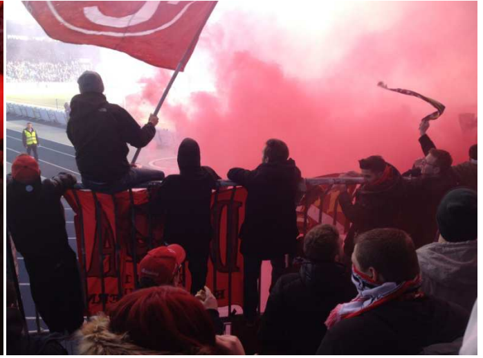
...für drei wichtige Punkte