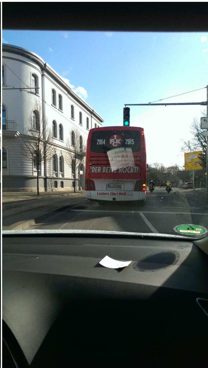
...un dann dabber em Bus hinnenoch!