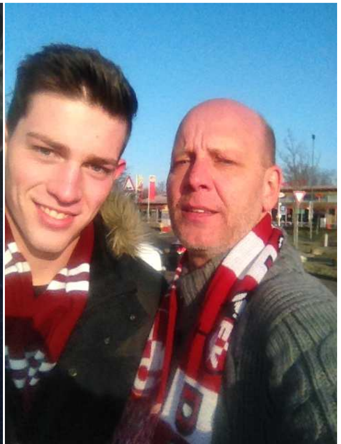
Hier schon wieder fit