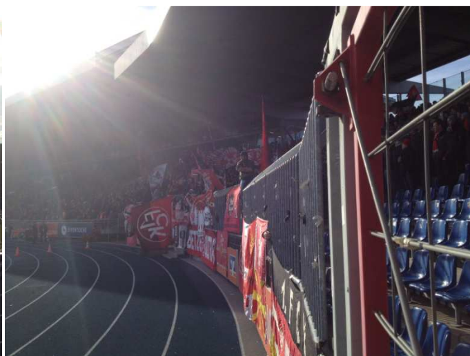
....der Lautrer Block füllt sich langsam