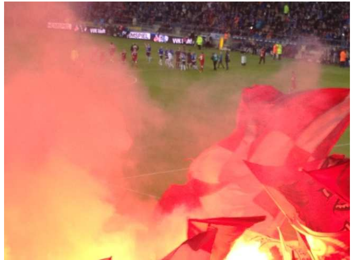
...mit Höllen-Atmosphäre und am Ende drei Punkte im Gepäck