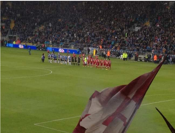
Auftakt zum Spiel...