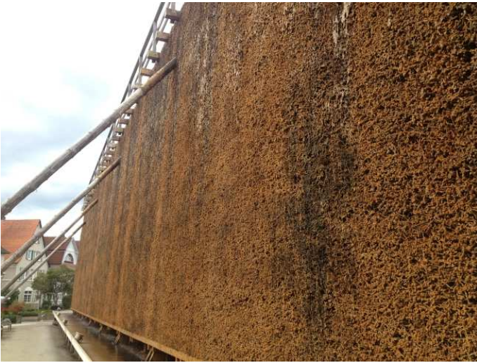
Tagsüber in Bielefeld – Salinenanlage...